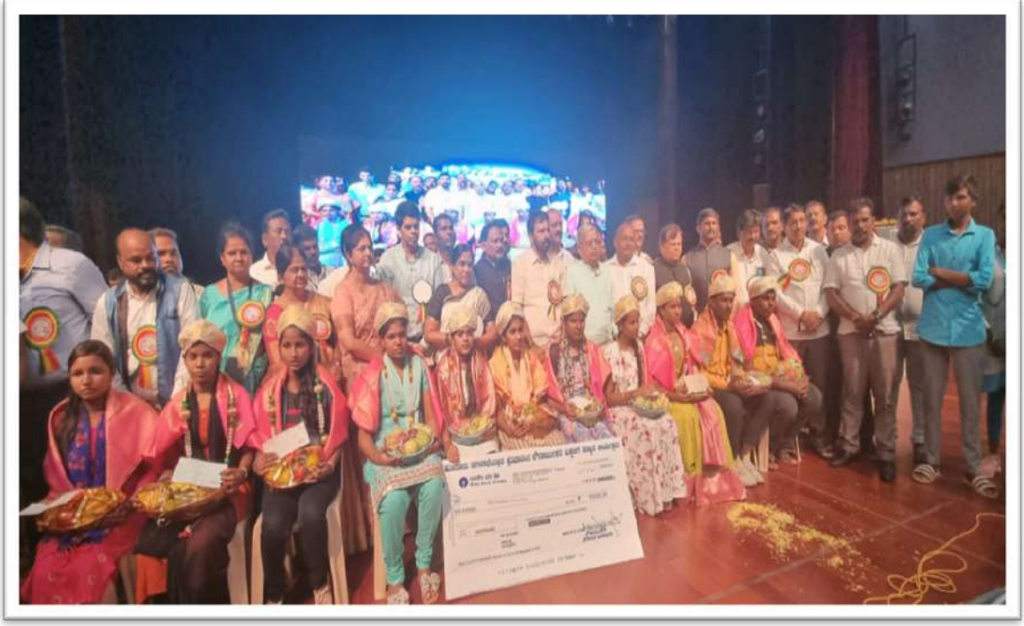
ಮೈಸೂರು ಜಿಲ್ಲೆಯಲ್ಲಿ ನಡೆದ ಪ್ರತಿಭಾ ಪುರಸ್ಕಾರ ಕಾರ್ಯಕ್ರಮ