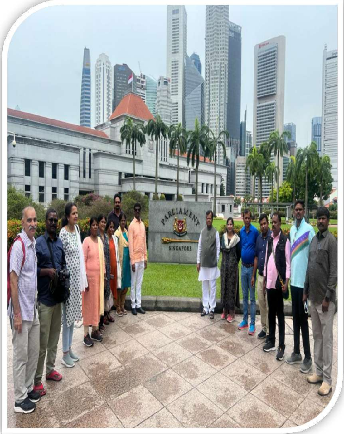
ಪಾಲಮೆಂಟ್ ಹೌಸ್ ಸಿಂಗಪೂರದಲ್ಲಿ ಅಧ್ಯಯನ ಪ್ರವಾಸ