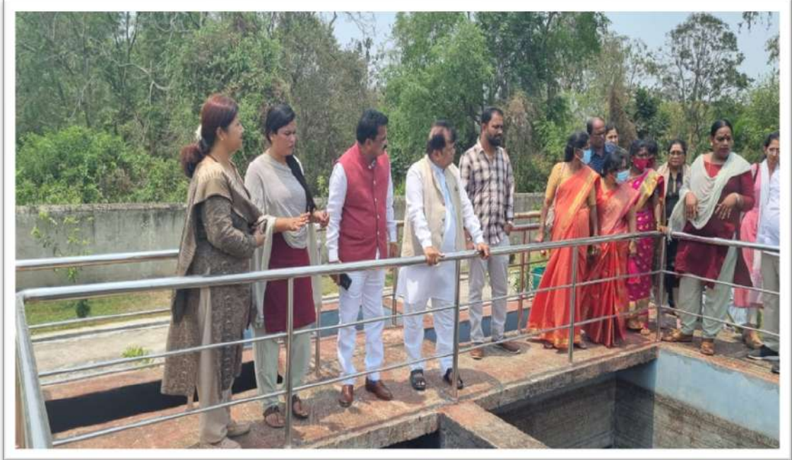
ಕಟಕ್ ನಗರದಲ್ಲಿ ಮಂಗಳಮುಖಯ ಸಂಘದಿಂದ ನಿರ್ವಹಿಸಲ್ಪಡುತ್ತಿರುವ ಎಸ್‌ಟಿಪಿ ಪ್ಲಾಂಟ್