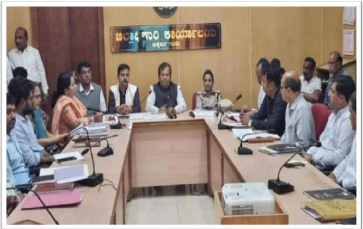
ಚಿಕ್ಕಮಗಳೂರು ಜಿಲ್ಲೆಯಲ್ಲಿ ನಡೆದ ಪೌರಕಾರ್ಮಿಕರ ಕುಂದುಕೊರತೆಗಳ ಸಭೆ