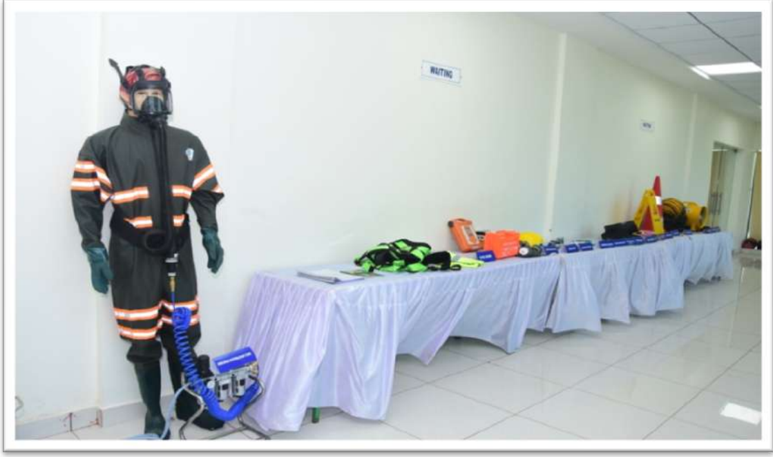
ಒಡಿಸ್ಸಾ ವಾಟರ್ ಅಕಾಡೆಮಿಯಲ್ಲಿ ಮ್ಯಾನ್‌ಹೋಲ್ ಸ್ವಚ್ಛಗೊಳಿಸಲು ಉಪಯೋಗಿಸುವ ಸುರಕ್ಷತಾ ಪರಿಕರಗಳು