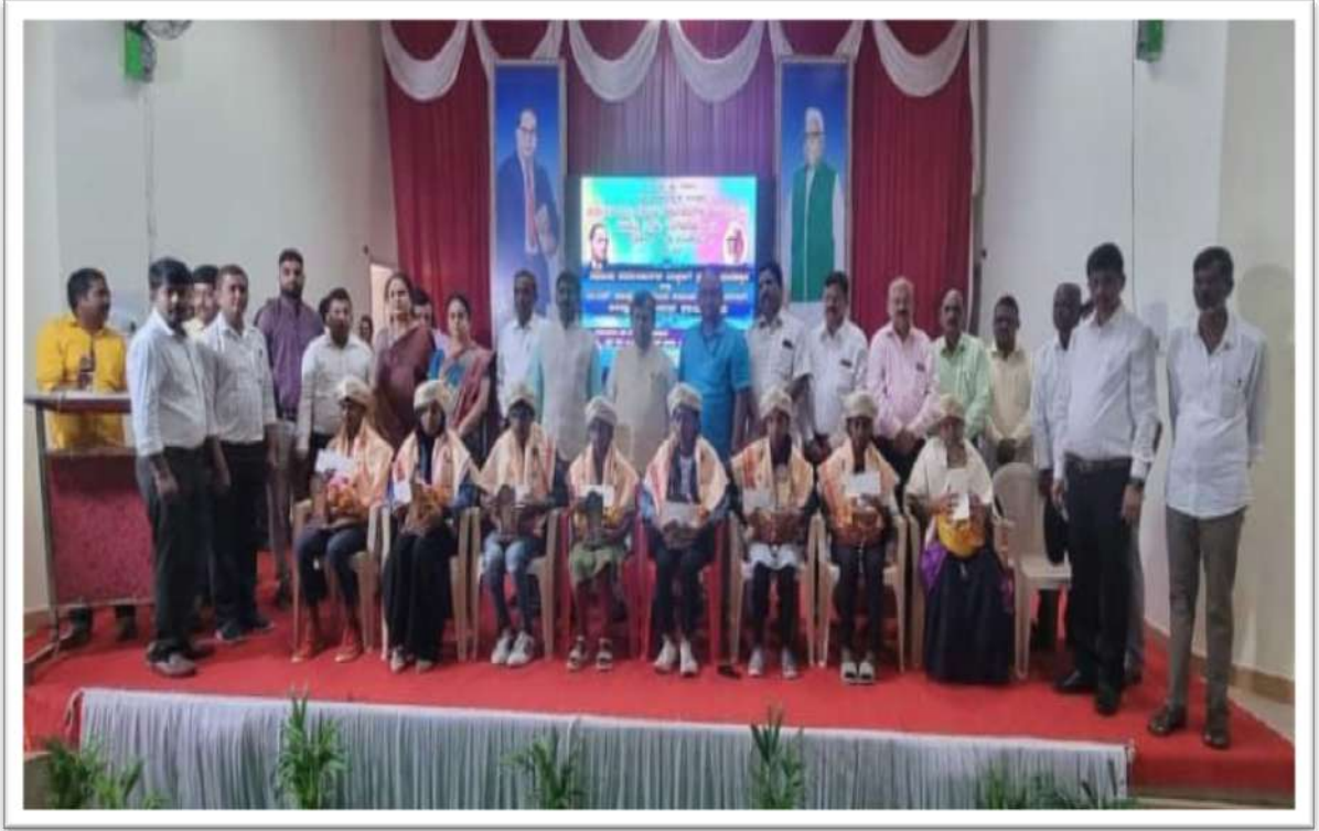
ಹಾಸನ ಜಿಲ್ಲೆಯಲ್ಲಿ ನಡೆದ ಸಫಾಯಿ ಕರ್ಮಚಾರಿ ಮಕ್ಕಳಿಗೆ ಪ್ರತಿಭಾ ಪುರಸ್ಕಾರ ಕಾರ್ಯಕ್ರಮ.