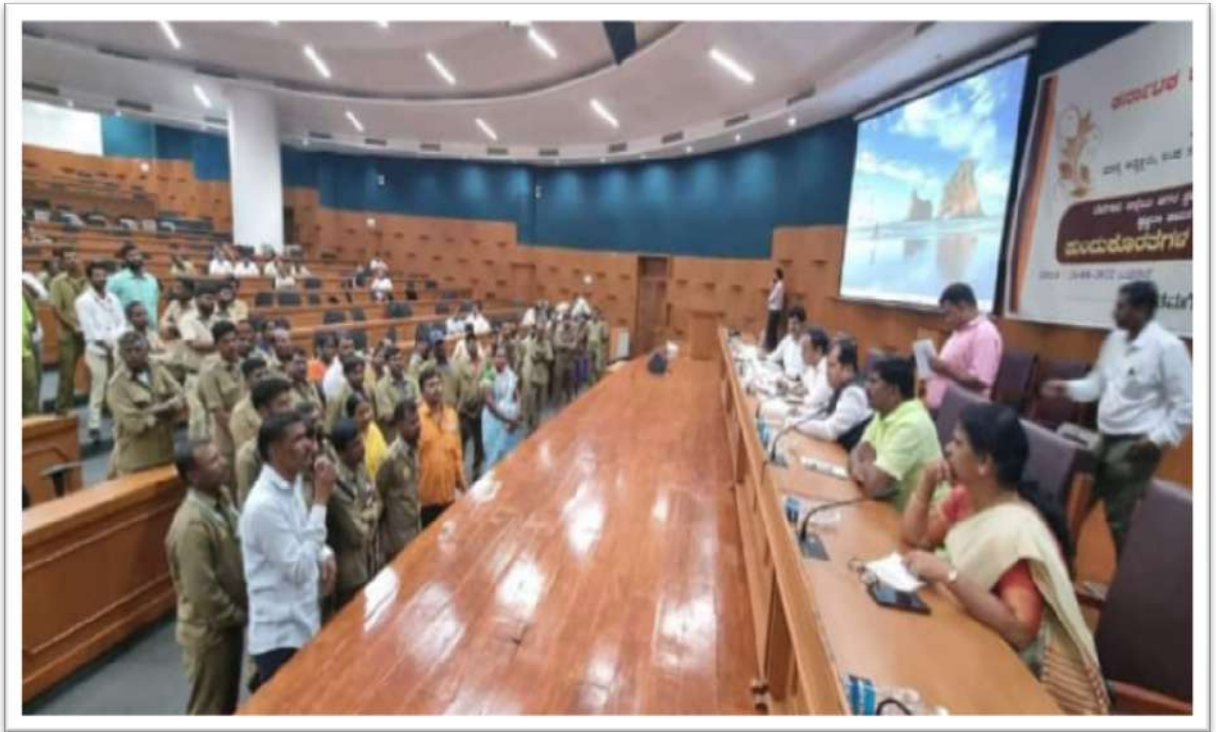
ಬೆಳಗಾವಿ ಜಿಲ್ಲೆಯಲ್ಲಿ ಸಫಾಯಿ ಕರ್ಮಚಾರಿಗಳ ಸಮಸ್ಯೆಗಳ ಬಗ್ಗೆ ಕಾರ್ಮಿಕರೊಡನೆ ಜಿಲ್ಲಾಡಳಿತದ ಅಧಿಕಾರಿಗಳು ಒಳಗೊಂಡಂತೆ ನೇರಸಂವಾದ ಕಾರ್ಯಕ್ರಮ.