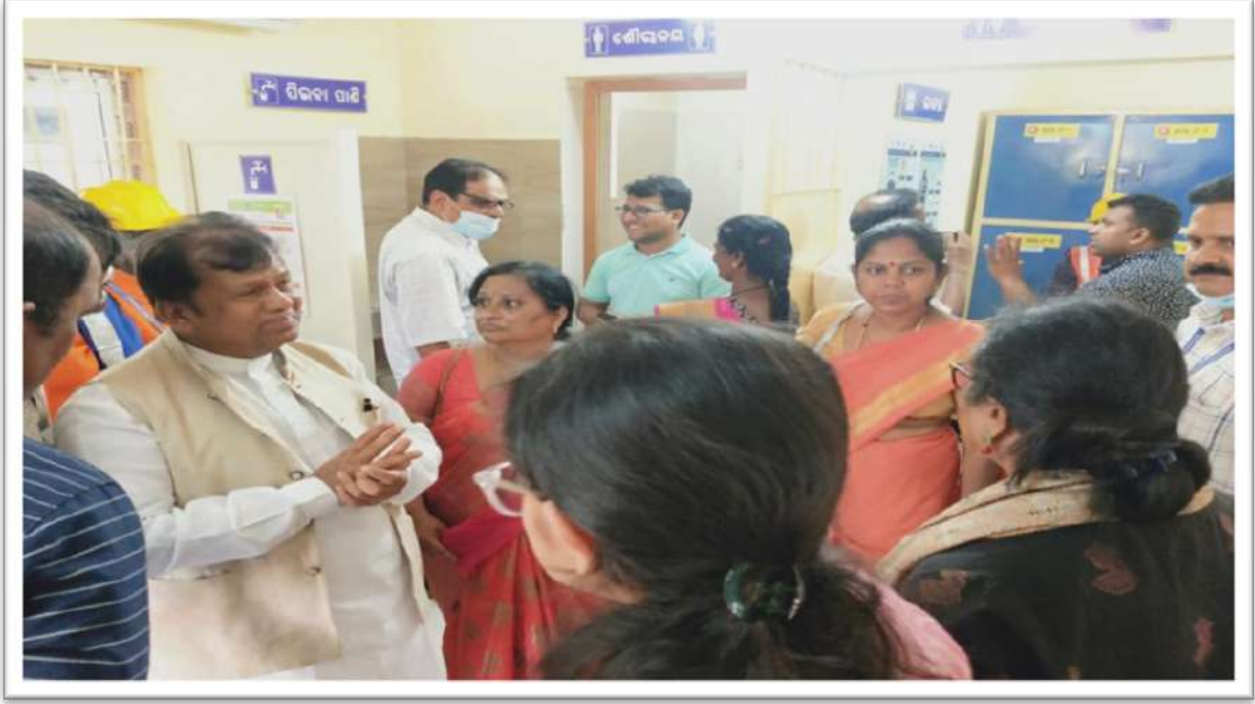
ಒಡಿಸ್ಸಾ ನಗರದಲ್ಲಿ ಸ್ಯಾನಿಟರಿ ವರ್ಕರ್ಸ್‌ಗಾಗಿ ನಿರ್ಮಾಣ ಮಾಡಿರುವ ಹವಾನಿಯಂತ್ರಿತ ವಿಶ್ರಾಂತಿಗೃಹದಲ್ಲಿ ಒದಗಿಸಿರುವ ಸ್ನಾನಗೃಹ ಮತ್ತು ಲಾಕರ್‌ಗಳ ವೀಕ್ಷಣೆ.