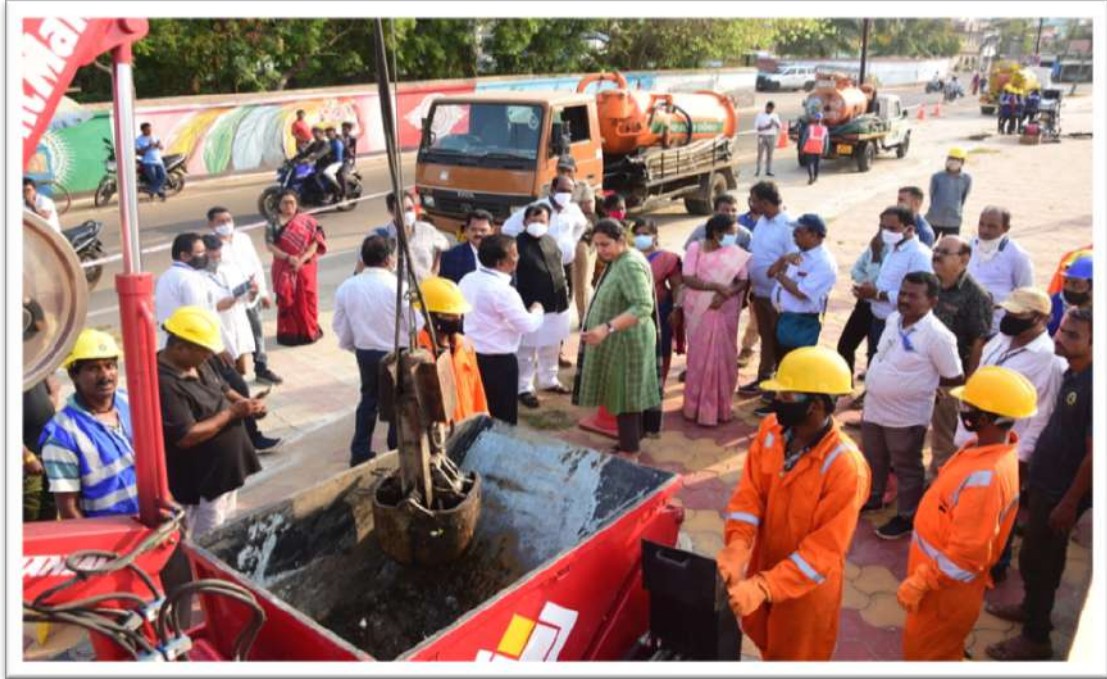
WATCO ಸಂಸ್ಥೆಯಲ್ಲಿ ಕಾರ್ಯನಿರ್ವಹಿಸುತ್ತಿರುವ ಸ್ವಚ್ಛತಾಗಾರರ ಸಮವಸ್ತ್ರ ಮತ್ತು ಯಂತ್ರೋಪಕರಣ