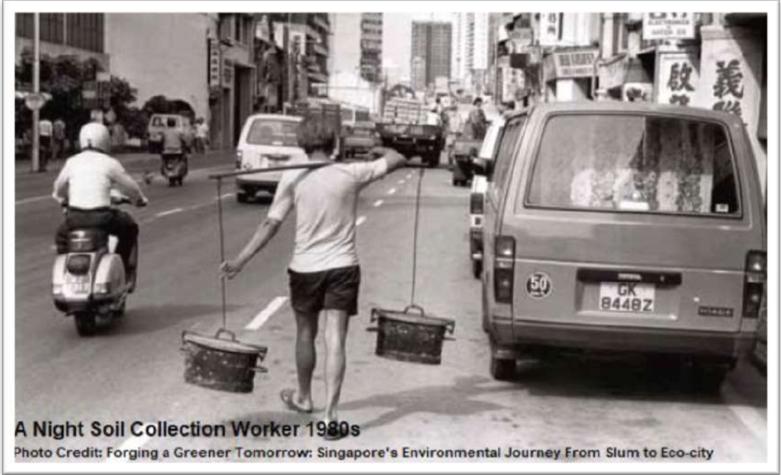
ಸಿಂಗಪೂರ ದೇಶದಲ್ಲಿ 1980ರಲ್ಲಿಯೂ ಸಹ ಮ್ಯಾನ್ಯೂಯಲ್ ಸ್ಕ್ವಾವೆಂಜಿಂಗ್ ಪದ್ಧತಿಯೂ ಜೀವಂತವಾಗಿದ್ದು, ಈಗ ಸಂಪೂರ್ಣವಾಗಿ ಯು.ಜಿ.ಡಿ ಸಿಸ್ಟಮ್ ಆಗಿ ಬದಲಾವಣೆಗೊಳಿಸಿರುತ್ತಾರೆ.