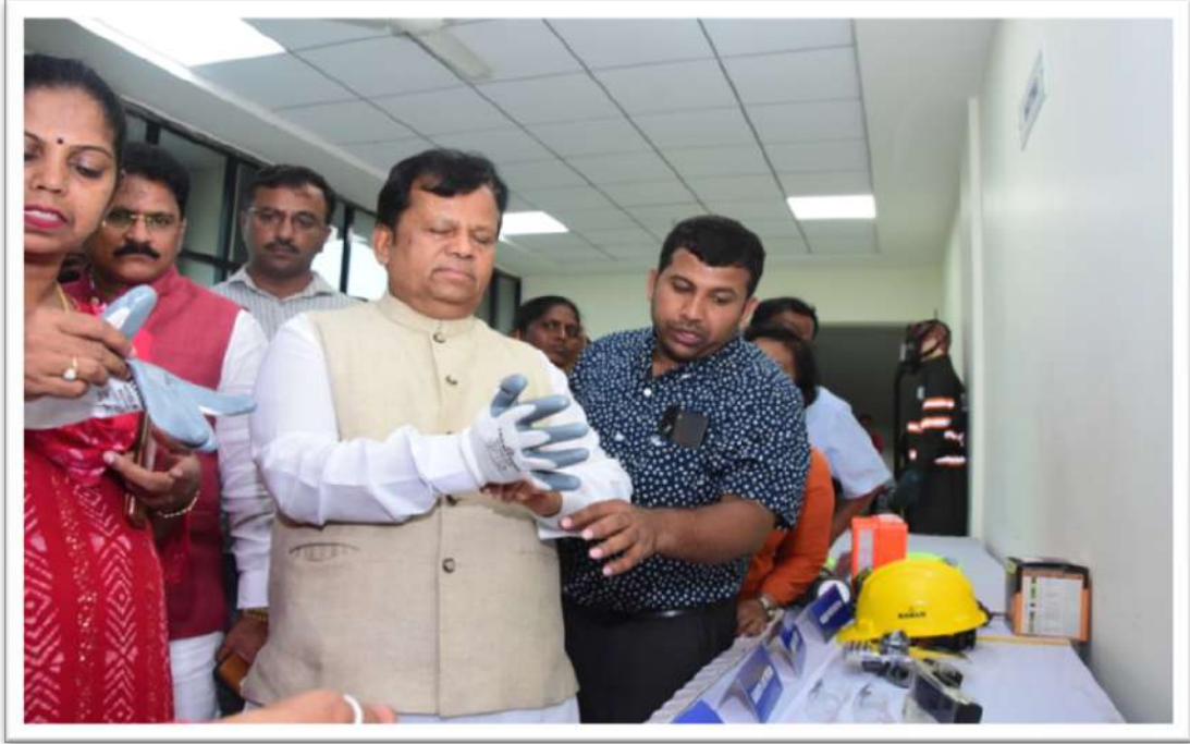
ಒಡಿಸ್ಸಾ ವಾಟರ್ ಅಕಾಡೆಮಿಯಲ್ಲಿ ಪ್ರದರ್ಶನಕ್ಕೆ ಇಟ್ಟಿರುವ ಸುರಕ್ಷತಾ ಪರಿಕರಗಳು