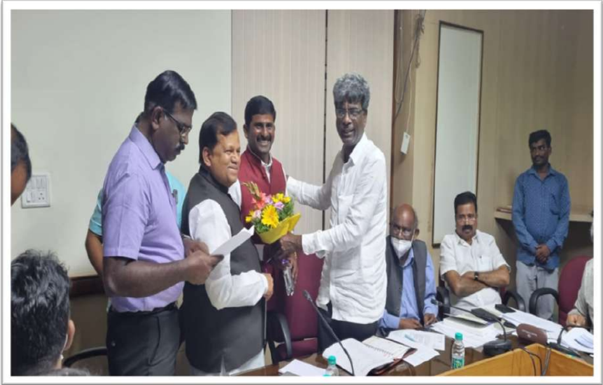
ನಿಗಮದ ಯೋಜನೆಗಳನ್ನು ಅನುಷ್ಠಾನಗೊಳಿಸಲು ಸಮಾಜ ಕಲ್ಯಾಣ ಇಲಾಖಾ ಸಚಿವರು, ನಿಗಮದ ಅಧ್ಯಕ್ಷರು ಮತ್ತು ಇಲಾಖಾ ಪ್ರಧಾನ ಕಾರ್ಯದರ್ಶಿಗಳೊಂದಿಗೆ ಸಮಾಲೋಚನೆ.