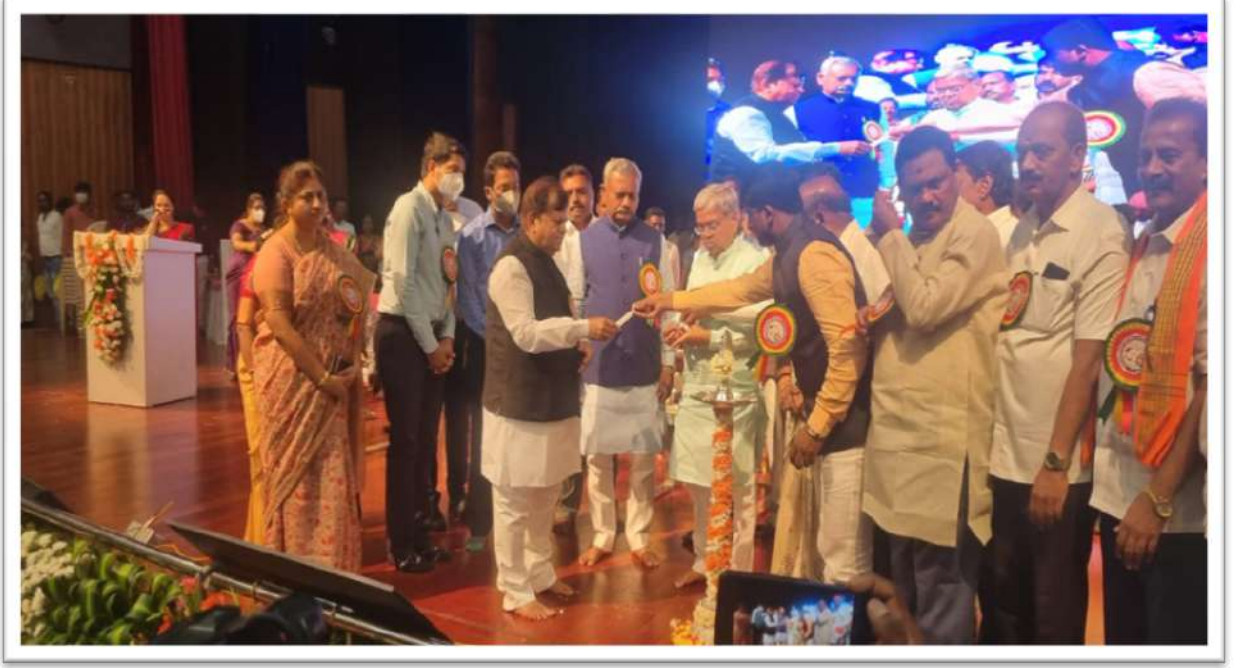
ಮೈಸೂರು ಜಿಲ್ಲೆಯಲ್ಲಿ ನಡೆದ ಪ್ರತಿಭಾ ಪುರಸ್ಕಾರ ಕಾರ್ಯಕ್ರಮ

ರಾಜ್ಯದ ಸಫಾಯಿ ಕರ್ಮಚಾರಿ ಮತ್ತು ಗುರುತಿಸಲ್ಪಟ್ಟ ಮ್ಯಾನ್ಯುಯಲ್ ಸ್ವಾವೆಂಜರ್ ಪ್ರತಿಭಾವಂತ ಮಕ್ಕಳನ್ನು ಜಿಲ್ಲಾ ಉಸ್ತುವಾರಿ ಸಚಿವರು ಜಿಲ್ಲಾಡಳಿತ, ಜಿಲ್ಲಾ ಪಂಚಾಯತ್, ಎಲ್ಲಾ ಅಧಿಕಾರಿಗಳು ಒಳಗೊಂಡಂತೆ ಪ್ರತಿಭಾ ಪುರಸ್ಕಾರ ಕಾರ್ಯಕ್ರಮದಲ್ಲಿ ಸನ್ಮಾನಿಸಲಾಯಿತು.