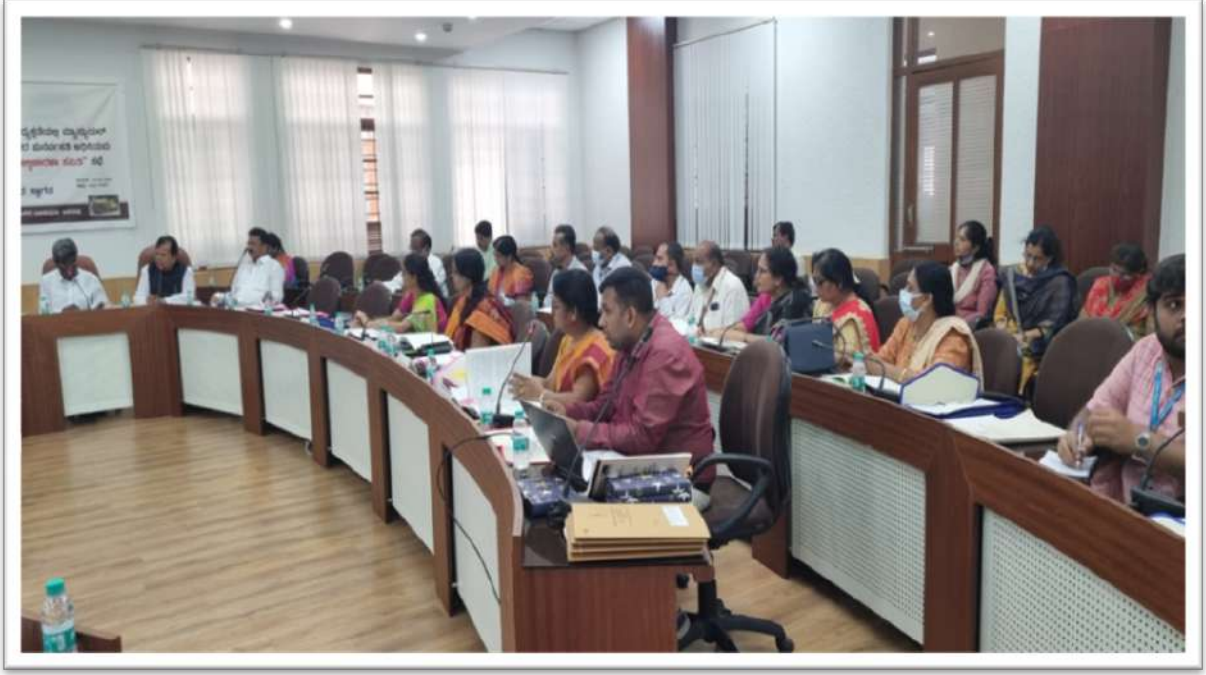
ವಿಕಾಸಸೌಧದಲ್ಲಿ ನಡೆದ ಮ್ಯಾನ್ಯುಯಲ್ ಸ್ಟ್ಯಾಪ್‌ಇಂಜರ್ಸ್ ನೇಮಕಾತಿ ನಿಷೇಧ ಮತ್ತು ಅವರ ಪುನರ್ವಸತಿ ಕಾಯ್ದೆ 2013ರ ಸೆಕ್ಷನ್-26 ರನ್ವಯ ರಚಿಸಿರುವ ರಾಜ್ಯ ಮೇಲ್ವಿಚಾರಣಾ ಸಮಿತಿಯ 5ನೇ ಸಭೆ.