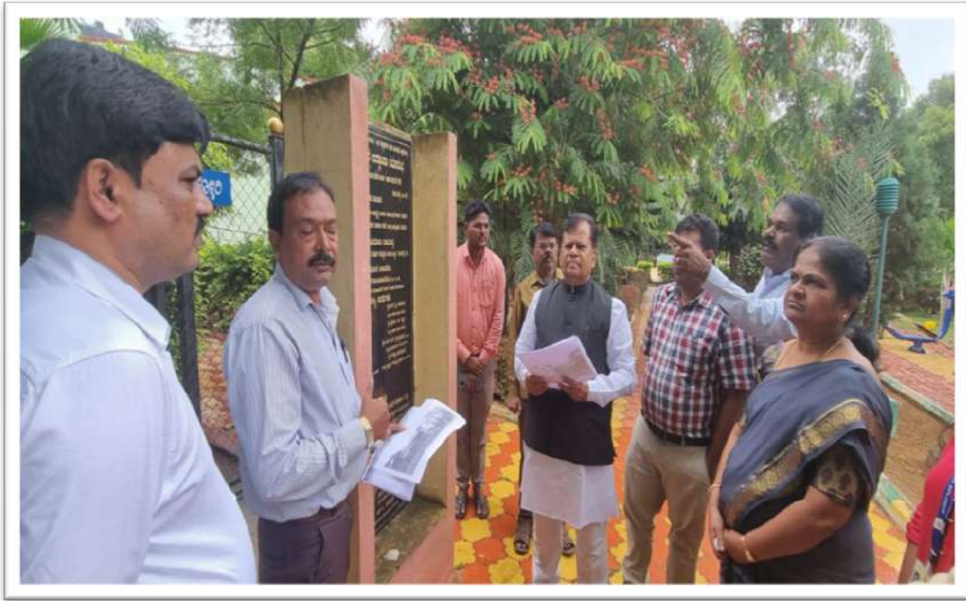
ಗದಗ್‌ನಲ್ಲಿ ನಿರ್ಮಿಸಲಾಗಿರುವ ಪೌರಕಾರ್ಮಿಕರ ವಿಶ್ರಾಂತಿಗೃಹವನ್ನು ವಿಲಕ್ಷಿಸಿದ ಕ್ಷಣ.