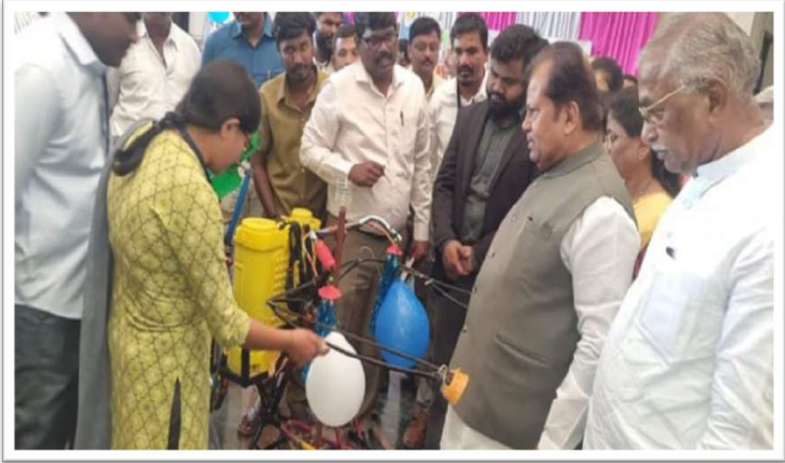
ಬಾಗಲಕೋಟೆಯಲ್ಲಿ ಪೌರಕಾರ್ಮಿಕರಿಂದ ಏರ್ಪಡಿಸಿದ ವಸ್ತುಪ್ರದರ್ಶನದ ವೀಕ್ಷಣೆ