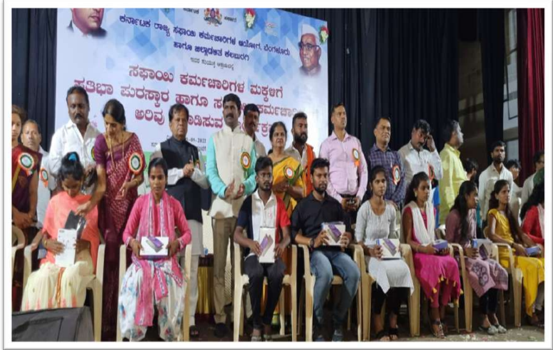
ಕಲಬುರ್ಗಿ ಜಿಲ್ಲೆಯಲ್ಲಿ ನಡೆದ ಸರ್ಕಾರಿ ಕಾರ್ಯಾಲಯಗಳ ಮಕ್ಕಳ ಪ್ರತಿಭಾ ಪುರಸ್ಕಾರ ಕಾರ್ಯಕ್ರಮ.