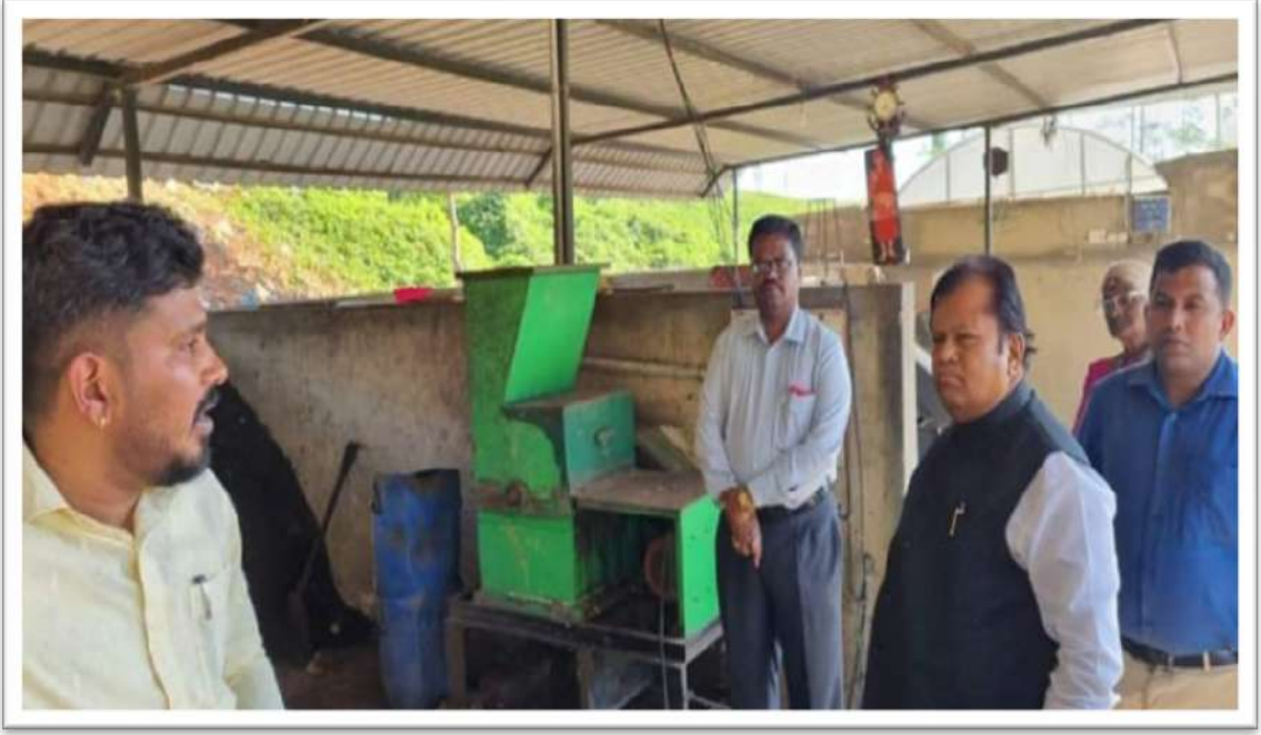
ಕರ್ನಾಟಕದಲ್ಲಿ ಪ್ರಥಮ ಬಾರಿಗೆ ದೇವನಹಳ್ಳಿಯಲ್ಲಿ ನಿರ್ಮಿಸಲಾಗಿರುವ ಮೂಲ ಸಂಸ್ಕರಣಾ ಘಟಕ ವೀಕ್ಷಣೆ