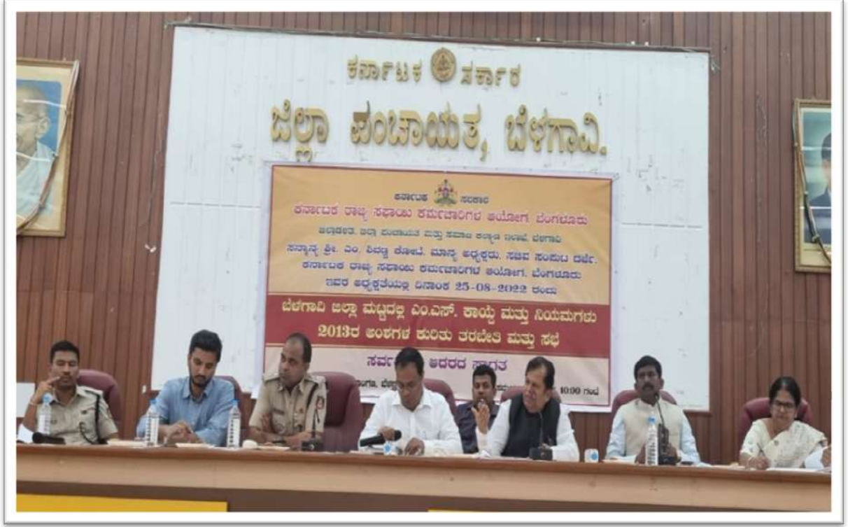
ಬೆಳಗಾವಿ ಜಿಲ್ಲಾಮಟ್ಟದಲ್ಲ ಎಂ.ಎಸ್. ಕಾಯ್ದೆ ಮತ್ತು ನಿಯಮಗಳು 2013ರ ಅಂಶಗಳ ಕುರಿತು ತರಬೇತಿ ಮತ್ತು ಸಭೆ.