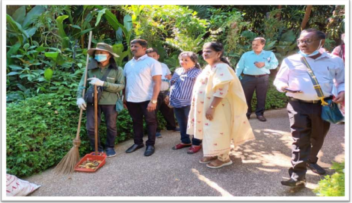
ಸಿಂಗಪೂರದಲ್ಲಿ ಅತೀ ಪ್ರಸಿದ್ಧವಾದ ಪಾರ್ಕ್‌ನ್ನು ಸ್ವಚ್ಛಗೊಳಿಸುವಂತಹ ಕಾರ್ಮಿಕರೊಂದಿಗೆ ಸಂವಾದ ನಡೆಸಿದ ಕ್ಷಣ